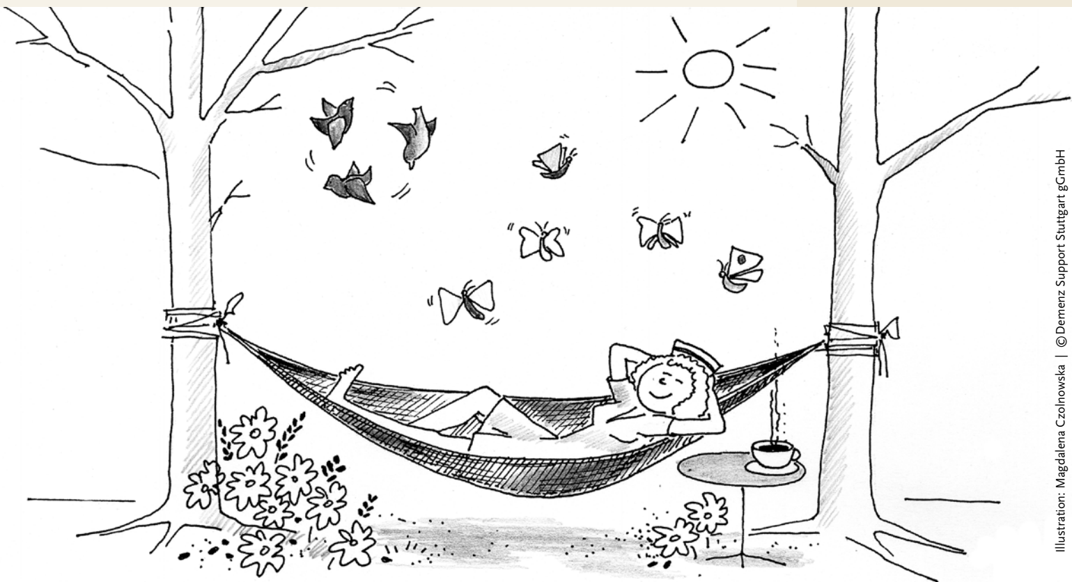
Illustration: Magdalena Czolnowska